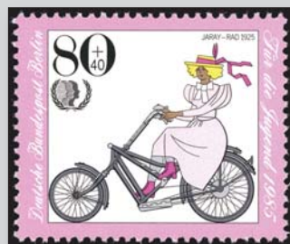
Die Sitzhaltung der Dame auf dem Jaray-Rad von 1925 kennt man heute eher von Herren der Schöpfung auf der Harley Davidson. Die Adler-Werke meinten anno 1888, dass für Frauen ein Dreirad sicherer als ein Zweirad sei.

Der Zug zur Gleichberechtigung aller Menschen war und ist aber glücklicherweise nicht aufzuhalten. Heute schmunzeln wir über manche Erlebnisse der Altvorderen, müssen aber festhalten, dass es gerade in puncto Gleichberechtigung auch in unseren Tagen vieles gibt, das in 100 Jahren wohl ebenso belächelt wird.