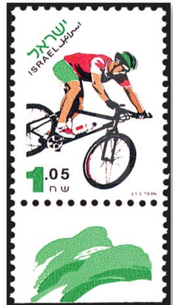
Der Wert zu 1,05 Shekel der ab 1996 aufgelegten israelischen Freimarkenserie mit Sportmotiven war dem Mountainbiking gewidmet.