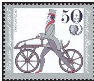
Während die Jugendmarke von 1985 ihr Sujet eher gediegen präsentiert, dokumentiert die aktuelle Sondermarken anschaulich, dass die doch etwas behäbige Laufmaschine längst Fahrrädern gewichen ist, die im Stadtverkehr mithalten können.

Karl Freiherr von Drais, der sein Adelsprädikat mit der badischen Revolution von 1848 ablegte, begnügte sich noch mit der Technologie, die jeder Stellmacher und Wagner beherrschte. Er montierte zwei Laufräder – darunter versteht man nicht angetriebene Räder – an einem hölzernen Gestell. Das vordere war lenkbar gelagert. Auf einem Sattel konnte Drais Platz nehmen, die Arme stützte er auf einer quer angebrachten Lehne ab. „Laufmaschine“ nannte er seine Erfindung kühn, den Begriff der Maschine ein wenig überdehnend. Werkzeug oder Apparat wären passender gewe-