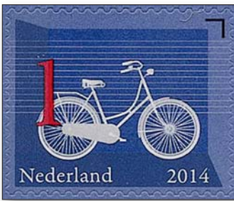
Das Hollandrad eignet sich als Stadt- und Tourenrad gleichermaßen. Die Post präsentierte es 2014 in einer Ausgabe, die verschiedene niederländische Ikonen vorstellte (Abb. Schwaneberger Verlag).

schweren oder gar tödlichen Verletzungen. Das Hochrad erwies sich daher als Sackgasse der Technikgeschichte.