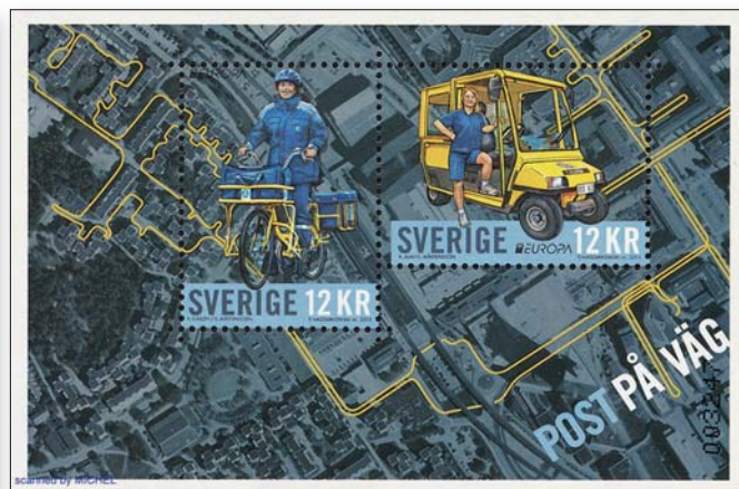
Aus der Postzustellung ist das Fahrrad nicht wegzudenken. Österreich präsentierte 2016 ein frühes Lastenfahrrad auf einem Block, derweil sich Schweden bereits 2013 der Elektromobilität zuwandte und ein Postfahrrad mit elektrischem Hilfsantrieb zeigte.