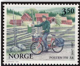
Schweden porträtierte 1999 eine Postzustellerin auf dem Fahrrad, Norwegen 1996 einen Landpostzusteller um 1975.

Schnurre des Forstmeisters, dessen Ideenreichtum schier unerschöpflich schien. Seine „Notenschriftmaschine“, die beim Klavierspielen die angeschlagenen Töne aufzeichnete, konnte sich ebenso wenig durchsetzen wie eine „Verbesserung der Feuerlöschanstalten“ und ein vierrädriger „Wagen ohne Pferde“, eine Art Vorgänger der Laufmaschine. Mit der Entwicklung eines dualen Rechensystems zeigte er, dass er auf dem rechten Weg voranschritt, doch gab es zum einen die ihm unbekannteren früheren Veröffentlichungen Gottfried Wilhelm Leibnizens, Thomas Harriots, Juan Caramuel y Lobkowitzens und Blaise Pascals, zum anderen noch keine Möglichkeit, sinnvoll allein mit den Zahlen Null und Eins zu rechnen. Die Zeitgenossen sahen daher in Drais keineswegs ein Genie, sonder eher einen verschrobene Adligen.