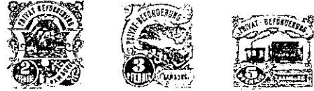
b) Segelschiff c) Briettaube d) Dampfstraßenbahn